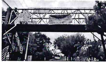
NACIONAL | Puntos de Vista | 17/11/2020